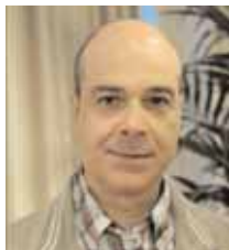
Fabio Massimo Capparoni